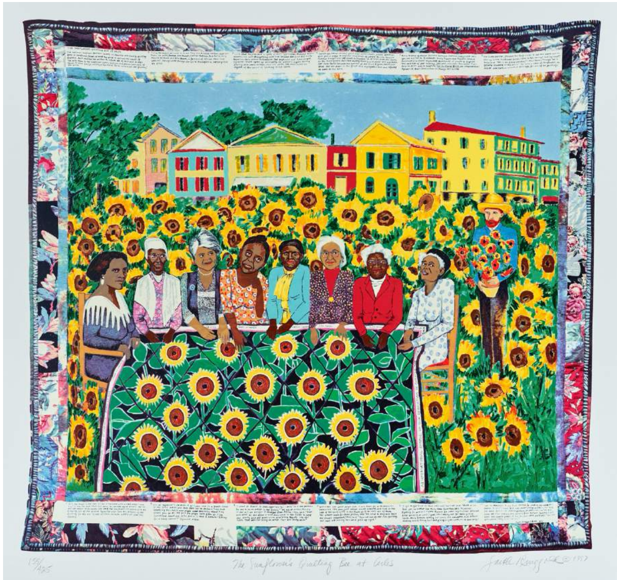
Faith Ringgold, "The French Collection, Part I, #4: Sunflowers Quilting Bee at Arles", acrylique sur toile, 56 x 76 cm, 1991