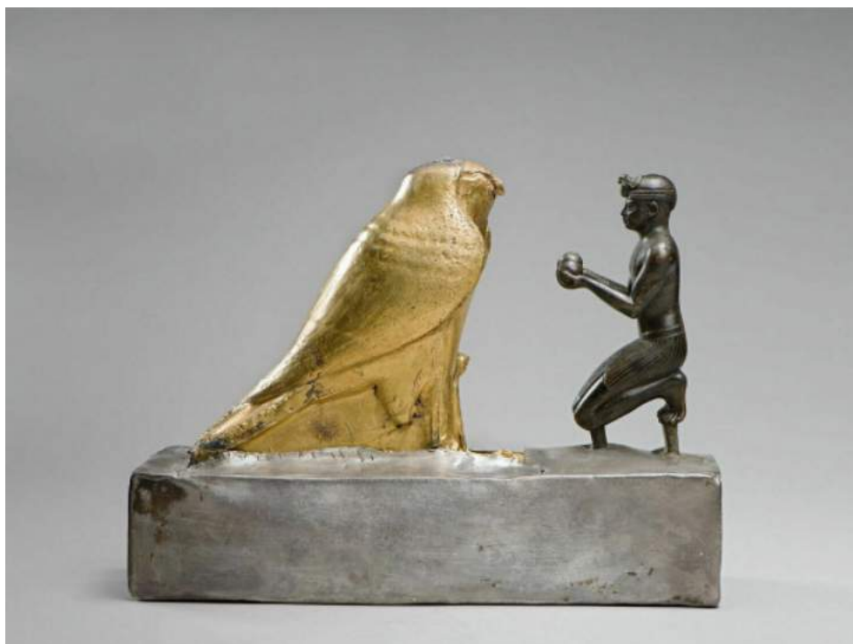
« Le roi Taharqa et le faucon Hémen », bois, bronze, schiste, argent et or, 19,7 x 26 x 10,3 cm, VIIe s. av. J.-C.

Ce stage partira d'une expérience qui enrichira les imaginaires de chacun autour de la thématique annuelle : le récit . Nous commencerons par une visite au Louvre à travers ses collections de l'art égyptien, grec, étrusque et romain. En nous plongeant dans ces temps reculés de l'Antiquité, à la découverte de ces civilisations anciennes et de leurs vestiges, nous tisserons des liens avec notre époque contemporaine.