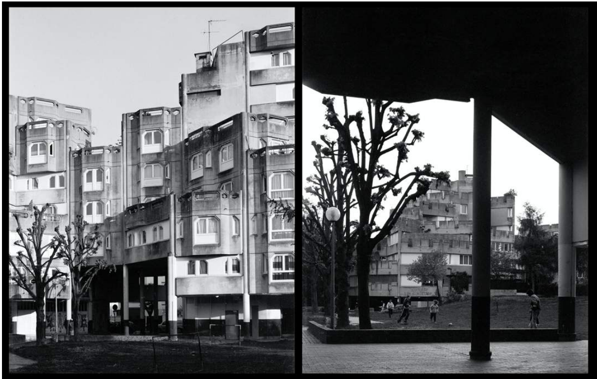
Atelier photo CAPA, Roberto Di Mola, 2023

Ce stage a pour but de proposer une approche de la photographie argentine noir et blanc, de la prise de vue au tirage en laboratoire. Après avoir exploré l'année passée les rudiments de la prise de vue au moyen d'appareils photo au format 24x36, je vous propose de continuer par l'utilisation d'appareils moyen et grand format.