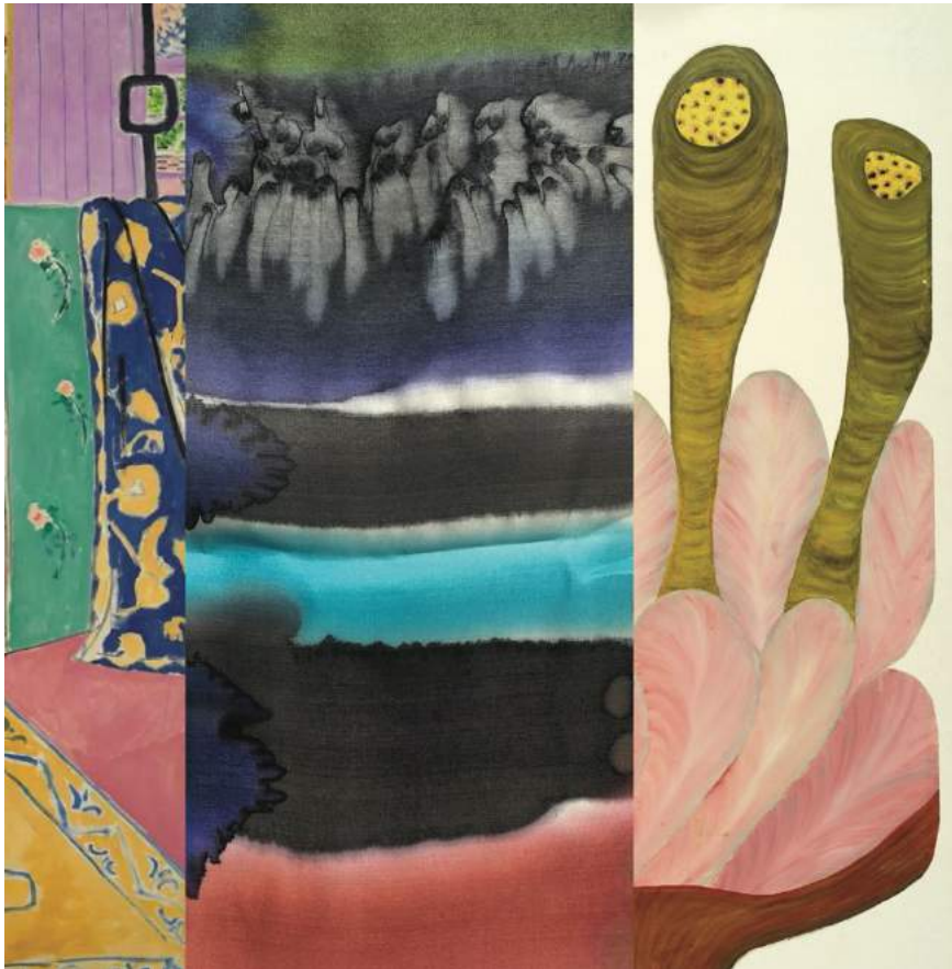
Images détails : Henri Matisse, « L'Atelier rose », 1911 / Nuancier peinture sur soie / Anna Zemánková, Sans titre, 1960