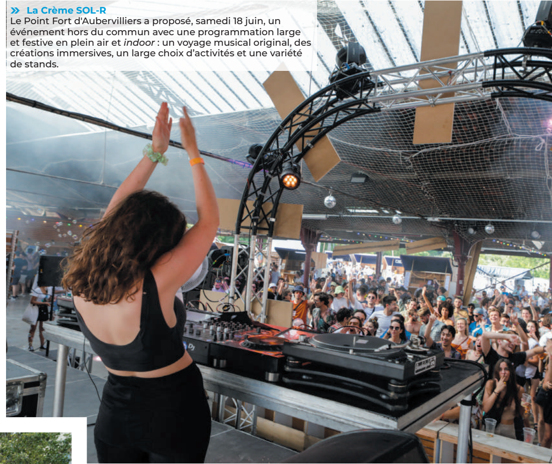
» La Crème SOL-R Le Point Fort d'Aubervilliers a proposé, samedi 18 juin, un événement hors du commun avec une programmation large et festive en plein air et indoor : un voyage musical original, des créations immersives, un large choix d'activités et une variété de stands.