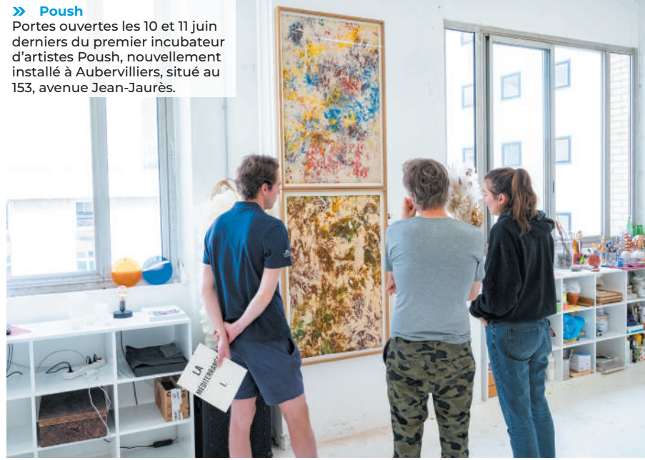
» Poush Portes ouvertes les 10 et 11 juin derniers du premier incubateur d'artistes Poush, nouvellement installé à Aubervilliers, situé au 153, avenue Jean-Jaurès.