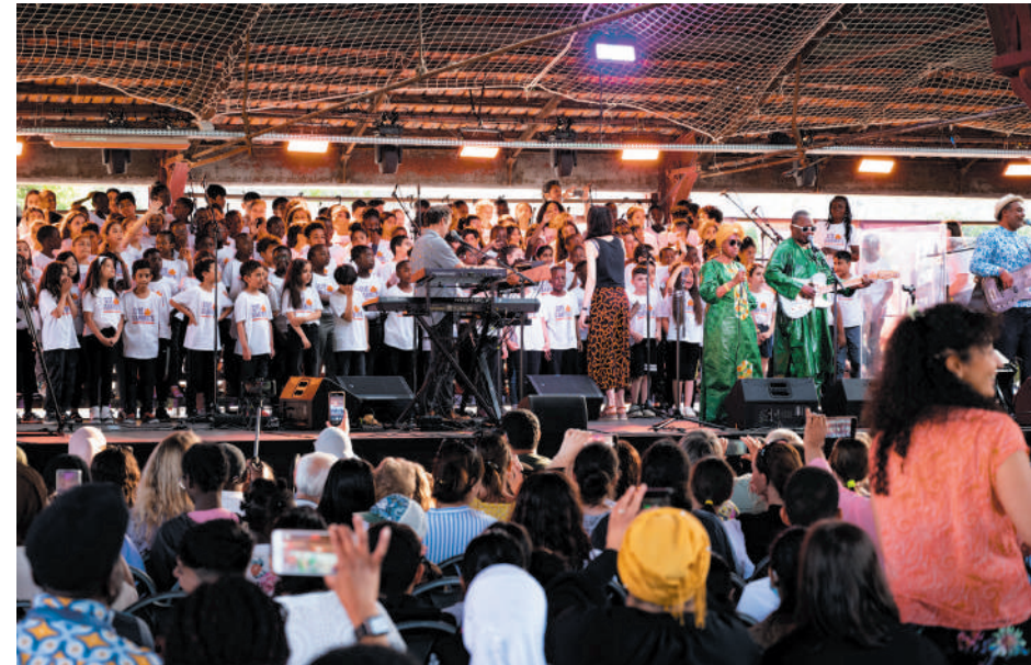
» Concert Cité des Marmots Concert du lundi 13 juin dans le cadre de la Cité des Marmots avec les musiciens maliens Amadou & Mariam et des enfants de 7 écoles d'Aubervilliers.