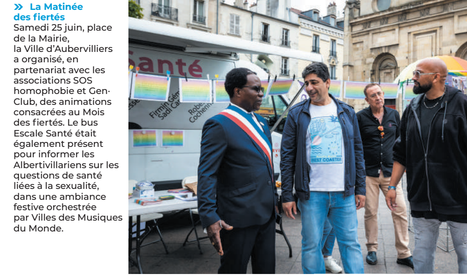
» La Matinée des fiertés Samedi 25 juin, place de la Mairie, la Ville d'Aubervilliers a organisé, en partenariat avec les associations SOS homophobie et Gen-Club, des animations consacrées au Mois des fiertés. Le bus Escale Santé était également présent pour informer les Albertvillariens sur les questions de santé liées à la sexualité, dans une ambiance festive orchestrée par Villes des Musiques du Monde.