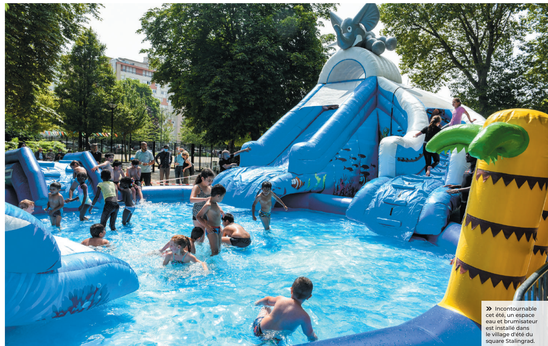
» Incontournable cet été, un espace eau et brumisateurs est installé dans le village d'été du square Stalingrad.

Des animations mêlant détente, convivialité, sports et jeux d'eau sont prévues en juliet et août dans tous les quartiers . Le tout ponctué de concerts, spectacles de cirque, expo photos et séances de cinéma en plein air. Découvrez le programme de l'été à Aubervilliers.