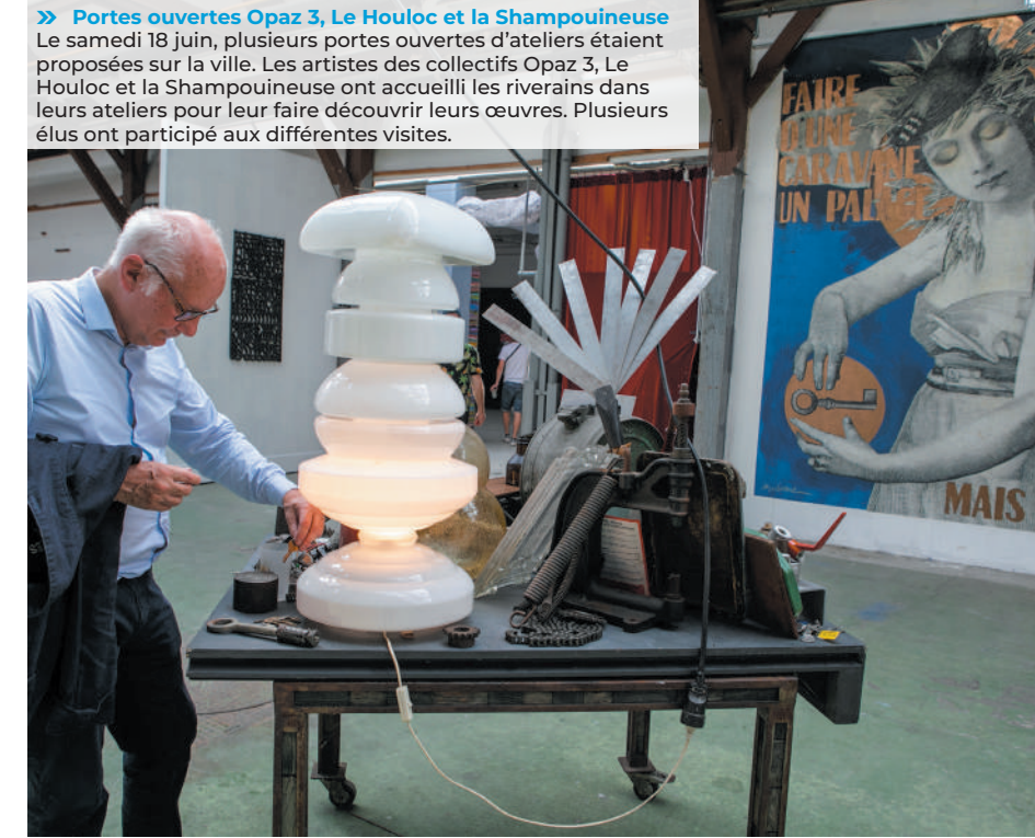
» Portes ouvertes Opaz 3, Le Houloc et la Champouineuse Le samedi 18 juin, plusieurs portes ouvertes d'ateliers étaient proposées sur la ville. Les artistes des collectifs Opaz 3, Le Houloc et la Champouineuse ont accueilli les riverains dans leurs ateliers pour leur faire découvrir leurs œuvres. Plusieurs élus ont participé aux différentes visites.