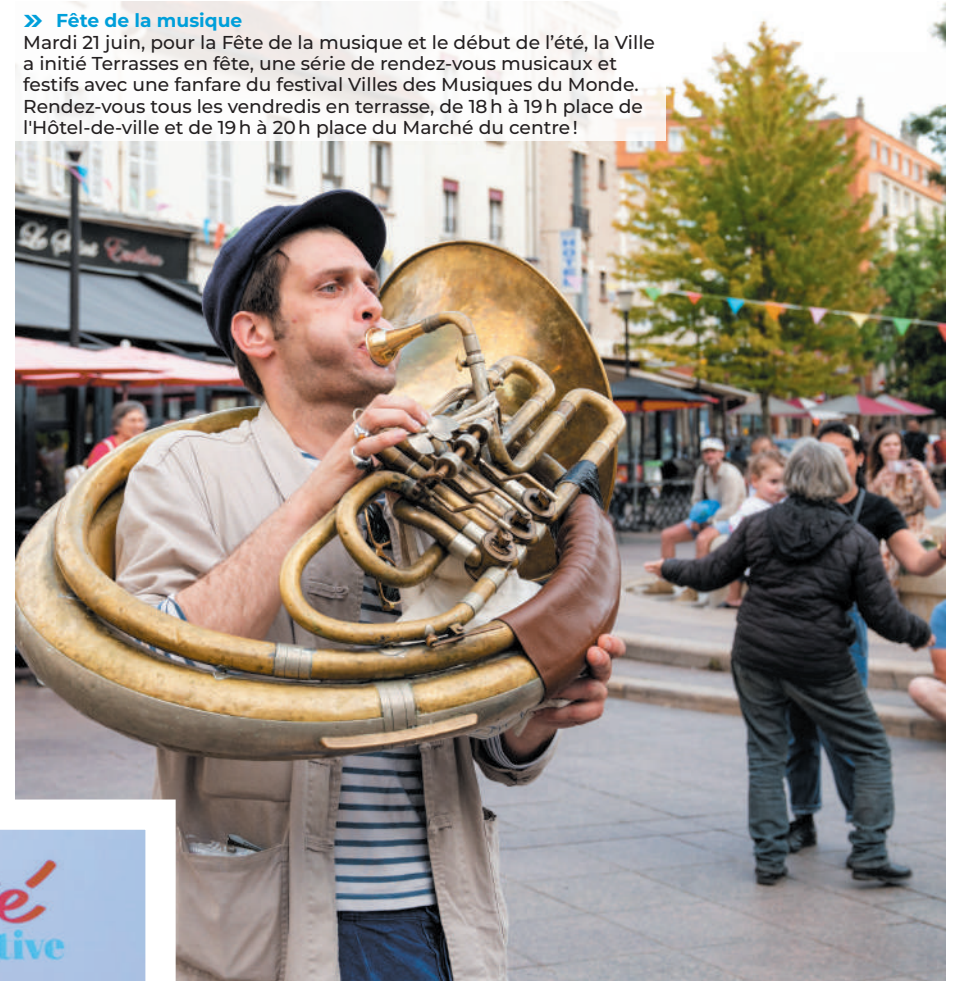
» Fête de la musique Mardi 21 juin, pour la Fête de la musique et le début de l'été, la Ville a initié Terrasses en fête, une série de rendez-vous musicaux et festifs avec une fanfare du festival Villes des Musiques du Monde. Rendez-vous tous les vendredis en terrasse, de 18 h à 19 h place de l'Hôtel-de-ville et de 19 h à 20 h place du Marché du centre!