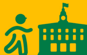
Plan n°1 – Plan d'emprises et de circulation

2 nouvelles stations de métro : Aimé Césaire - Mairie d'Aubervilliers